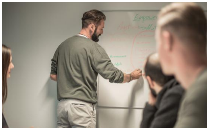
Ein persönlicher Coach hilft beim Einstieg ins Berufsleben.

Jungen Erwachsenen und ihren Eltern ist die Ausbildung viel