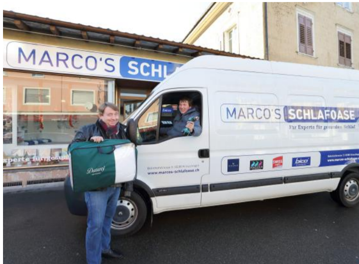
Ein Liefer- und Montageservice steht zur Verfügung.

Das aktuelle Top-Monatsangebot, gültig bis 31. Januar 2017: Gästebett in Schweizer Qualität, Echtholz Buche natur oder weiss inkl. Flex-Lattenrost, Kopfteil verstellbar, mit zwei Matratzen «Swiss Line» mit Wolle 2 x 90/