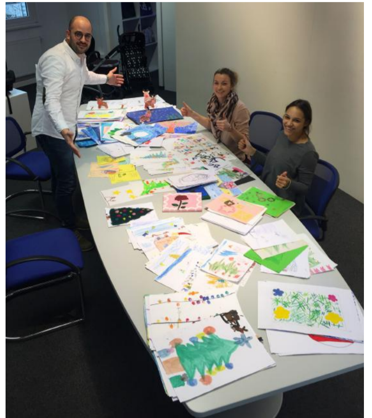
Hunderte kreative Bilder sind eingetroffen.

Herzlichen Dank allen mahlenden Händen. (pd)