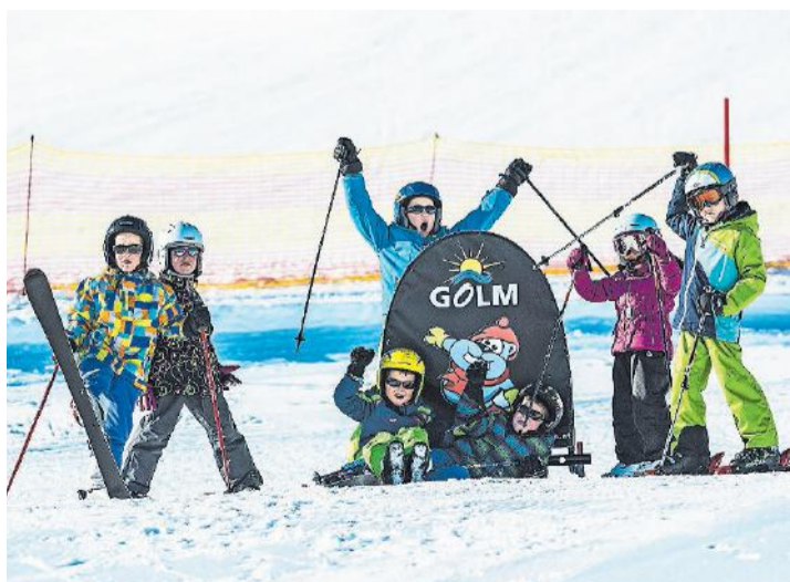
Im Kinderland lernen die Kleinen spielerisch Ski fahren.

Neben diesem Angebot bietet das Skigebiet Golm weitere Angebote abseits der Pisten an: Abenteuerlustige können über eine 2600 Meter lange, künstlich angelegte Rodelbahn – den Alpine-Coaster-Golm – auf Schienen nach Vandans fahren. Für jüngere und ältere Nichtskifahrer bietet das Skigebiet im Montafon